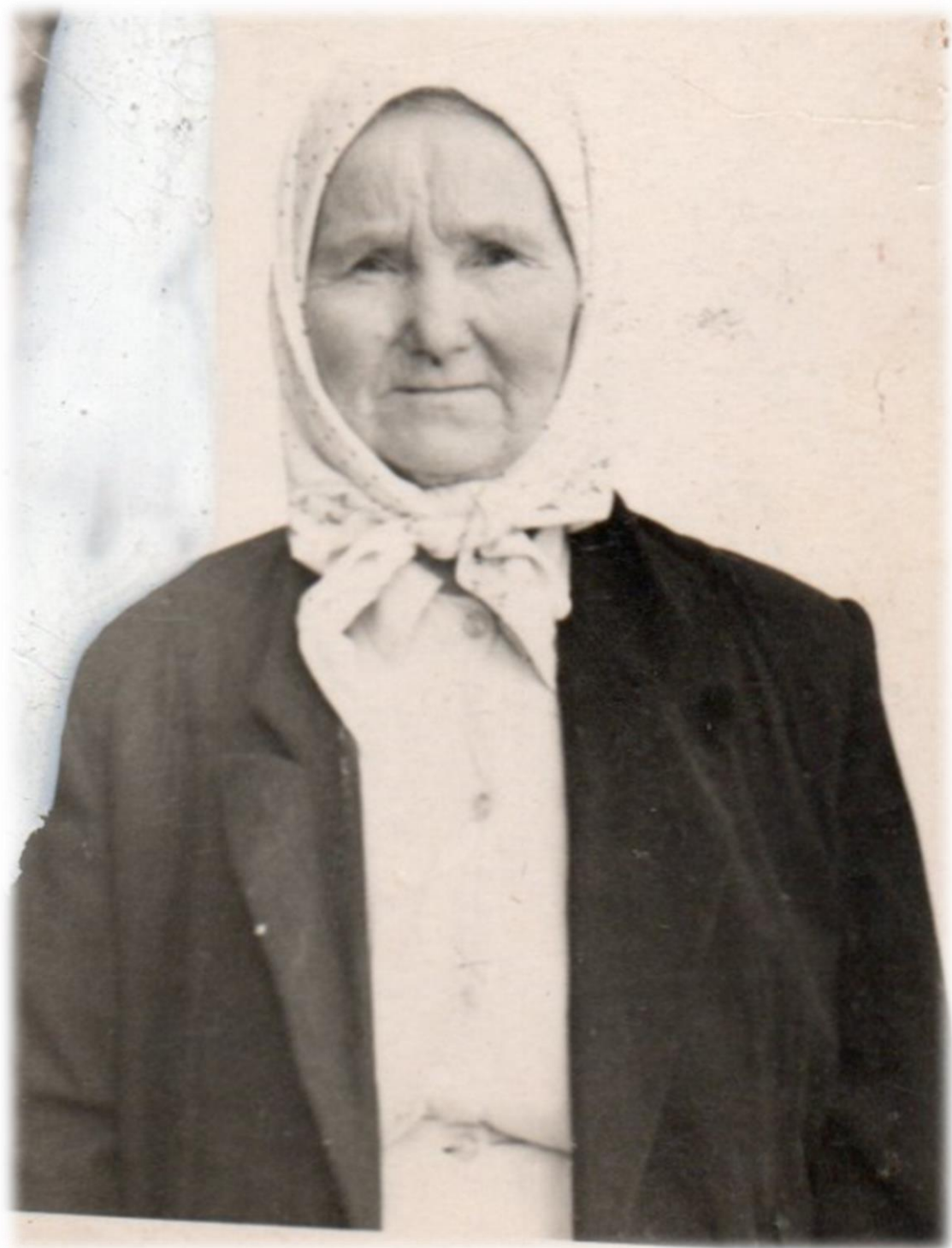
Прысвячаецца памяці маёй бабулі Рудзёнак Еўфрасінні Цімафееўны – ўраджэнкі в. Матырына Ушацкага раёна