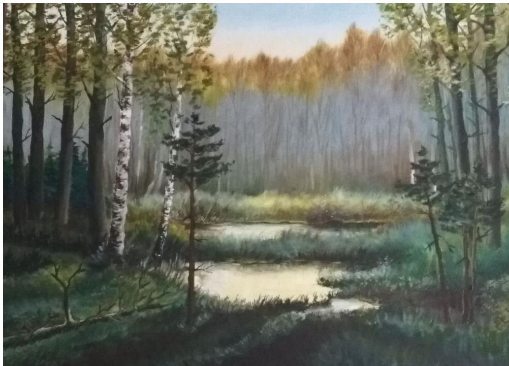
Картина «Тишина», М.Е.Клешторного