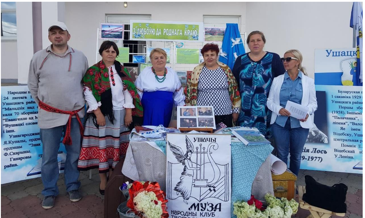
Каманда з Ушач на абласным свяце-конкурсе самадзейных паэтаў і кампазітараў "Песні сунічных бароў". Лёзна. 2019 год.