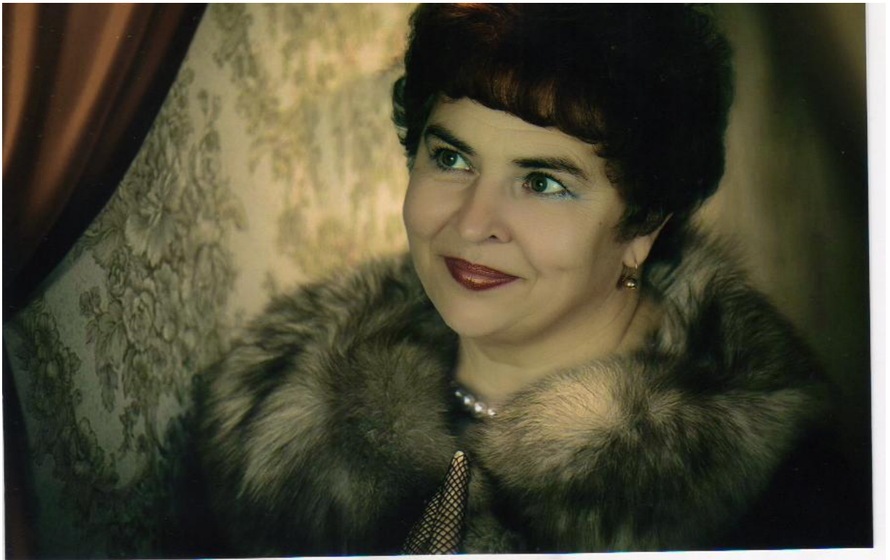
2011 год.