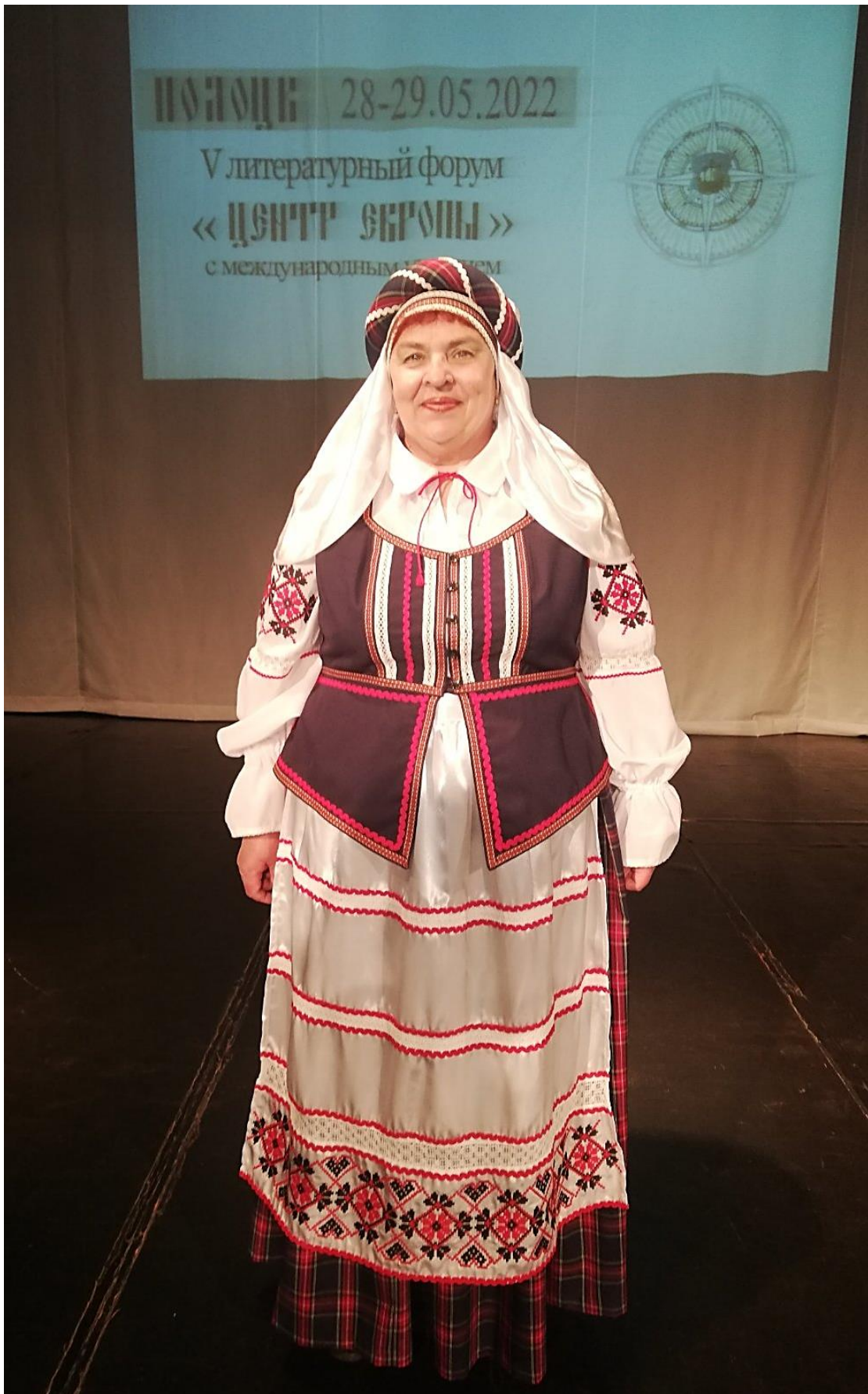
На конкурсе "Паэт-артыст" на літаратурным форуме з міжнародным удзелам "Цэнтр Еўропы". Г. Полацк. 2022 год.