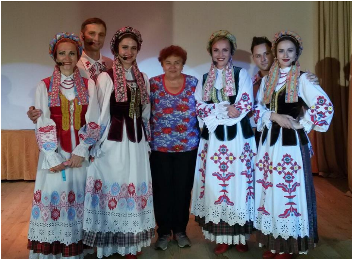
З калектывам ансамбля ”Талака“ пасля канцэрта ва Ушачах. 2022 год.