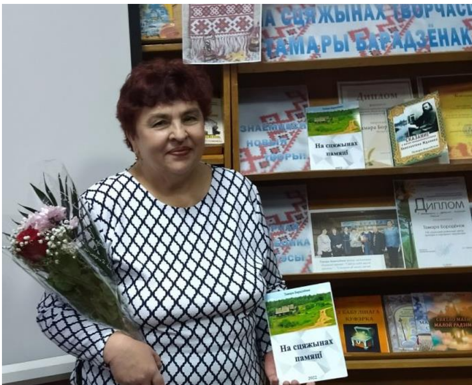
Прэзентацыя зборніка "На сцяжынах памяці" ва Ушацкай раённай бібліятэцы імя Е.Я.Лось. 2023 год.