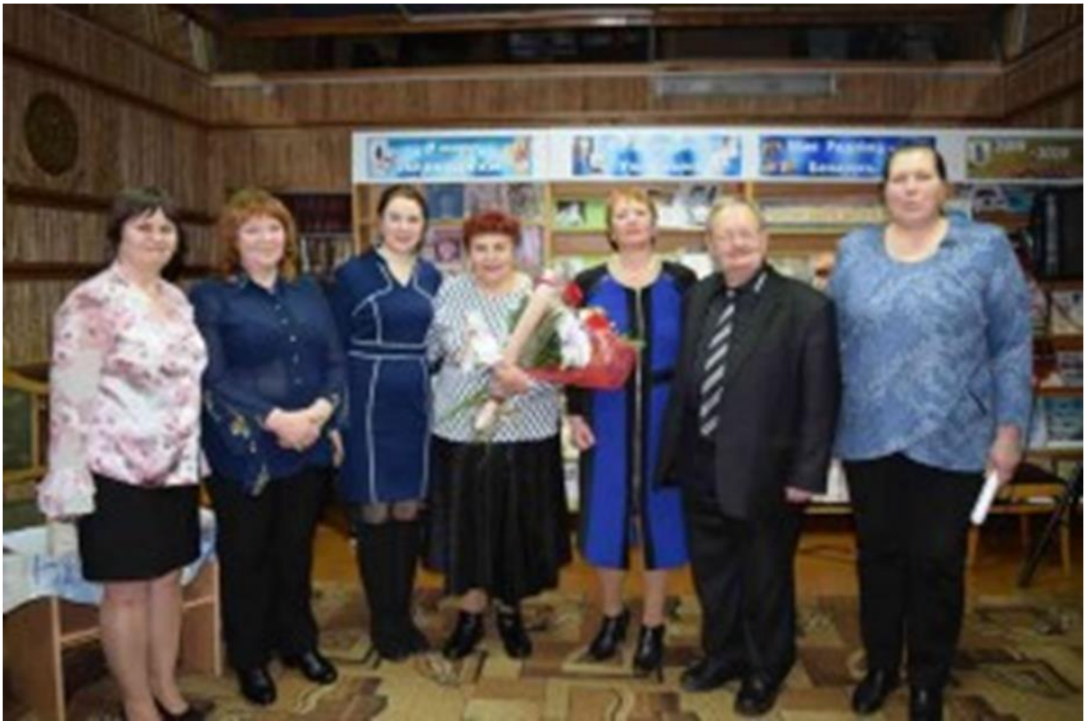
Падчас прэзентацыі зборніка ”Святло маёй малой радзімы“.