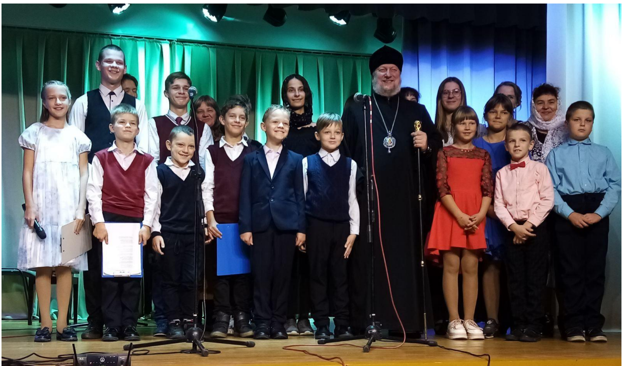
З выхаванцамі нядзельнай школы пры храме святых вялікапакутніц Мінадоры, Мітрадоры і Німфадоры і Ўладыкам Полацкім і Глыбоцкім Ігнаціем. 2022 год.