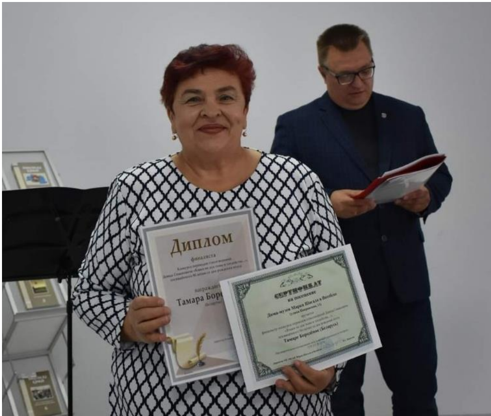
Фінал конкурсу перакладаў вершаў Давіда Сімановіча да 90-годдзя паэта. Віцебская абласная бібліятэка. 2022 год.